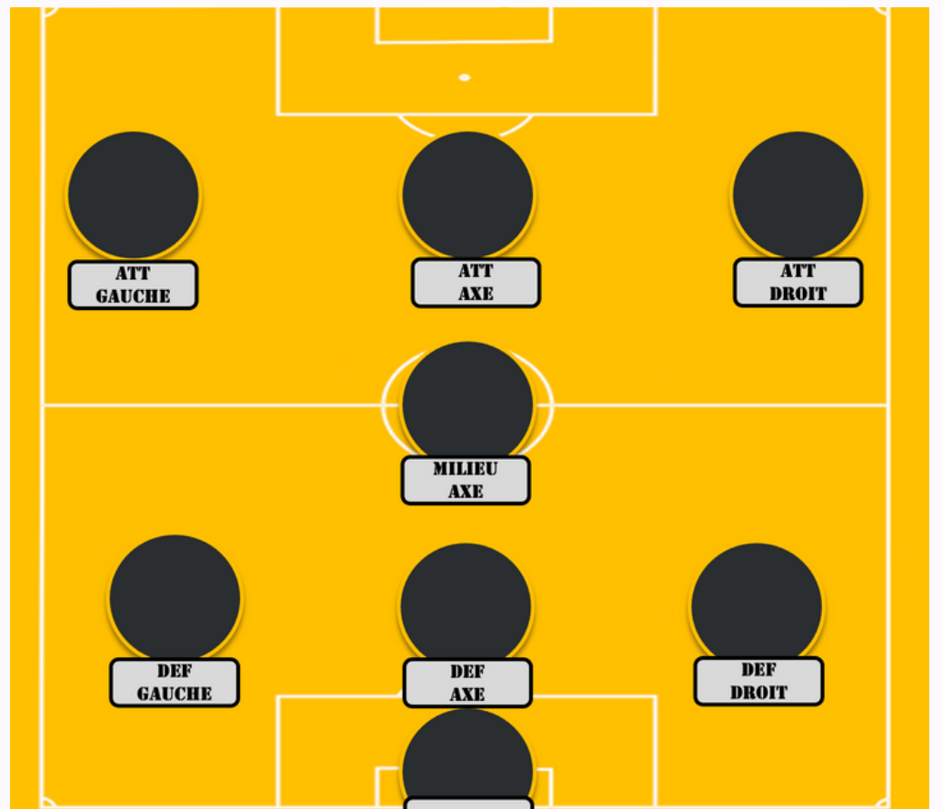
FOOT À 8